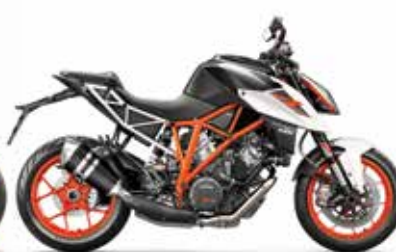
MODEL | KTM 1290 SUPER DUKE R

水冷4ストロークOHC4バルブ単気筒 692.7cc 105×80mm 55kW(75hp)/8,000rpm 74Nm/6,500rpm 12.7 : 1 6速 KEIHIN EFI(THROTTLE BODY50mm) KEIHIN製EMSダブルイグニッション・RBW※1 APTCスリッパークラッチ油圧操作式 3モード・解除可能/MSC・MTC・MSR※3 ハロゲン TFTフルカラー液晶ディスプレイ クロームモリブデン鋼トレリスフレーム(パウダーコート) アルミニウム(パウダーコート) アルミニウム φ 28/22 mm WP製倒立フォークφ43mmフルアジャスタブル WP製モノショック・プロレバリンクプリロードアジャスター 150/150 mm Brembo製ディスクブレーキ(BOSCH 9M+ABS)φ320mm Brembo製ディスクブレーキ(BOSCH 9M+ABS)φ240mm BOSCH 9M+ コーナリングABS (SUPERMOTOモード・解除可能) 3.50×17"/5.00×17" 120/70R-17"/160/60R-17" 63.5° 1,466±15mm 192mm 865mm 約14ℓ(3.2ℓリザーブ) 約147.5kg 2人 ブラック 2年間 オーストリア