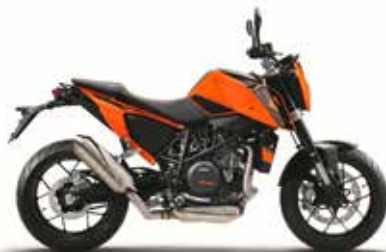
MODEL | KTM 690 DUKE