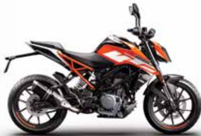
MODEL | KTM 250 DUKE