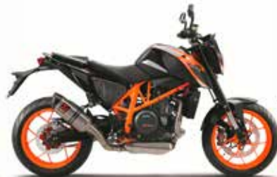
MODEL | KTM 690 DUKE R

水冷4ストロークOHC4バルブ単気筒 692.7cc 105×80mm 54kW(73hp)/8,000rpm 74Nm/6,500rpm 12.7 : 1 6速 KEIHIN EFI(THROTTLE BODY50mm) KEIHIN製EMSダブルイグニッション・RBW※1 APTCスリッパークラッチ油圧操作式 オプション:TRACK PACK※2 ハロゲン TFTフルカラー液晶ディスプレイ クロームモリブデン鋼トレリスフレーム(パウダーコート) アルミニウム(パウダーコート) アルミニウム φ 28/22 mm WP製倒立フォークφ43mm WP製モノショック・プロレバリンクプリロードアジャスター 135/135 mm Brembo製ディスクブレーキ(BOSCH 9M+ABS)φ320mm Brembo製ディスクブレーキ(BOSCH 9M+ABS)φ240mm BOSCH 9M+ ABS(解除可能) ※SUPERMOTOモードはオプション 3.50×17"/5.00×17" 120/70R-17"/160/60R-17" 63.5° 1,466±15mm 192mm 835mm 約14ℓ(3.2ℓリザーブ) 約148.5kg 2人 オレンジ/ホワイト 2年間 オーストリア