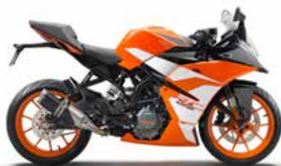
MODEL | KTM RC 125