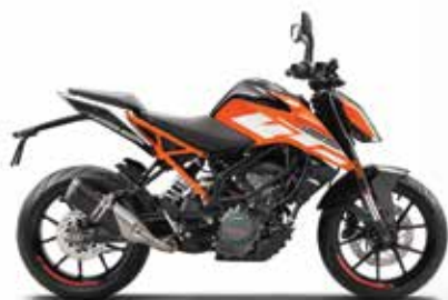
MODEL | KTM 125 DUKE