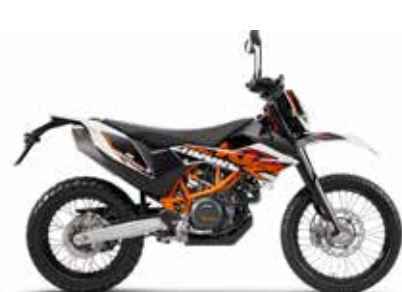
MODEL | KTM 1290 ADVENTURE T