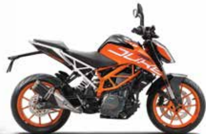
MODEL | KTM 390 DUKE