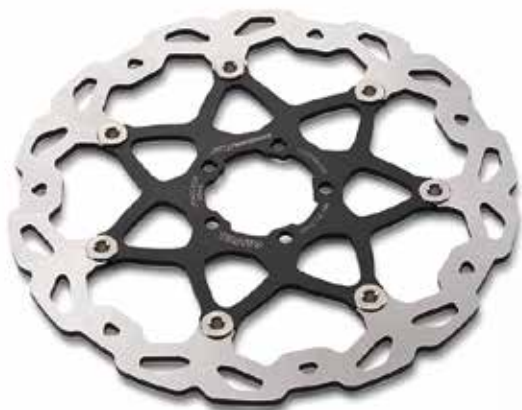
WAVE BRAKE DISC 320 MM

プレミアム品質のコンポーネントだけをラインアップする KTM POWERPARTS で、あなたの望み通りの性能を手に入れてください。ライディングスタイルや好みに合わせてあなたのマシンをユニークにカスタマイズすることが可能です。