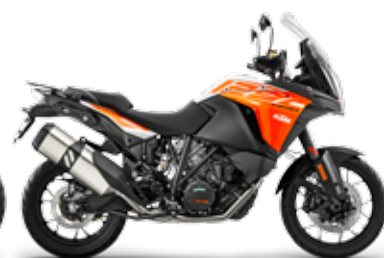
MODEL | KTM 1090 ADVENTURE