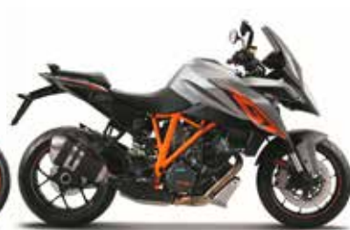
MODEL | KTM 1290 SUPER DUKE GT

水冷4ストロークDOHC4バルブ75°V型2気筒 1,301cc 108×71mm 130kW(177hp)/9,750rpm 141Nm/7,000rpm 13.6 : 1 6速(クイックシフター+ Up/Down) KEIHIN EFI(THROTTLE BODY56mm) KEIHIN製EMSダブルイグニッション・RBW※1・クルーズコントロール付 PASCスリッパークラッチ湿式多板・油圧操作式 3モード・解除可能 MTC オプション:TRACK PACK※8/PERFORMANCE PACK※9 LED(コーナリングライト付) TFTフルカラー液晶ディスプレイ/KTM RACE ON※11 クロームモリブデン鋼トレリスフレーム(パウダーコート) クロームモリブデン鋼トレリス構造(パウダーコート) アルミニウム φ 28/22 mm WP製倒立フォークφ48mmフルアジャスタブル WP製モノショック・プリロードアジャスター 125/156 mm Brembo製モノブロック4ピストン ダブルディスクブレーキφ320mm Brembo製2ピストン ディスクブレーキ φ240mm BOSCH 9.1MP コーナリングABS (SUPERMOTO モード・解除可能) 3.50×17"/6.00×17" 120/70ZR-17"/190/55ZR-17"(TPMS付※12) 65.1° 1,482±15mm 141mm 835mm 約18ℓ(3.5ℓリザーブ) 約195kg 2人 ホワイト 2年間 オーストリア