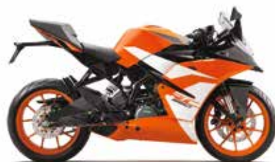
MODEL | KTM RC 250