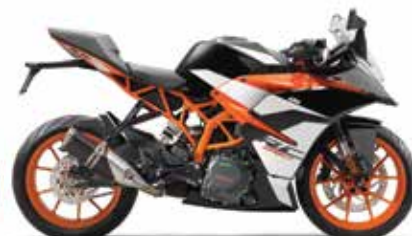
MODEL | KTM RC 390