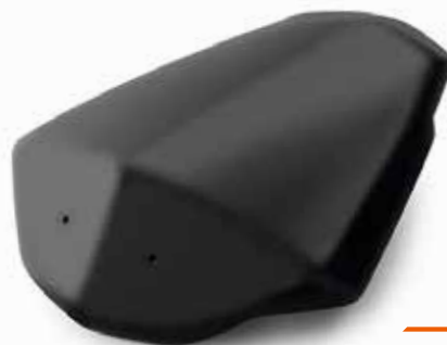
PILION SEAT COVER